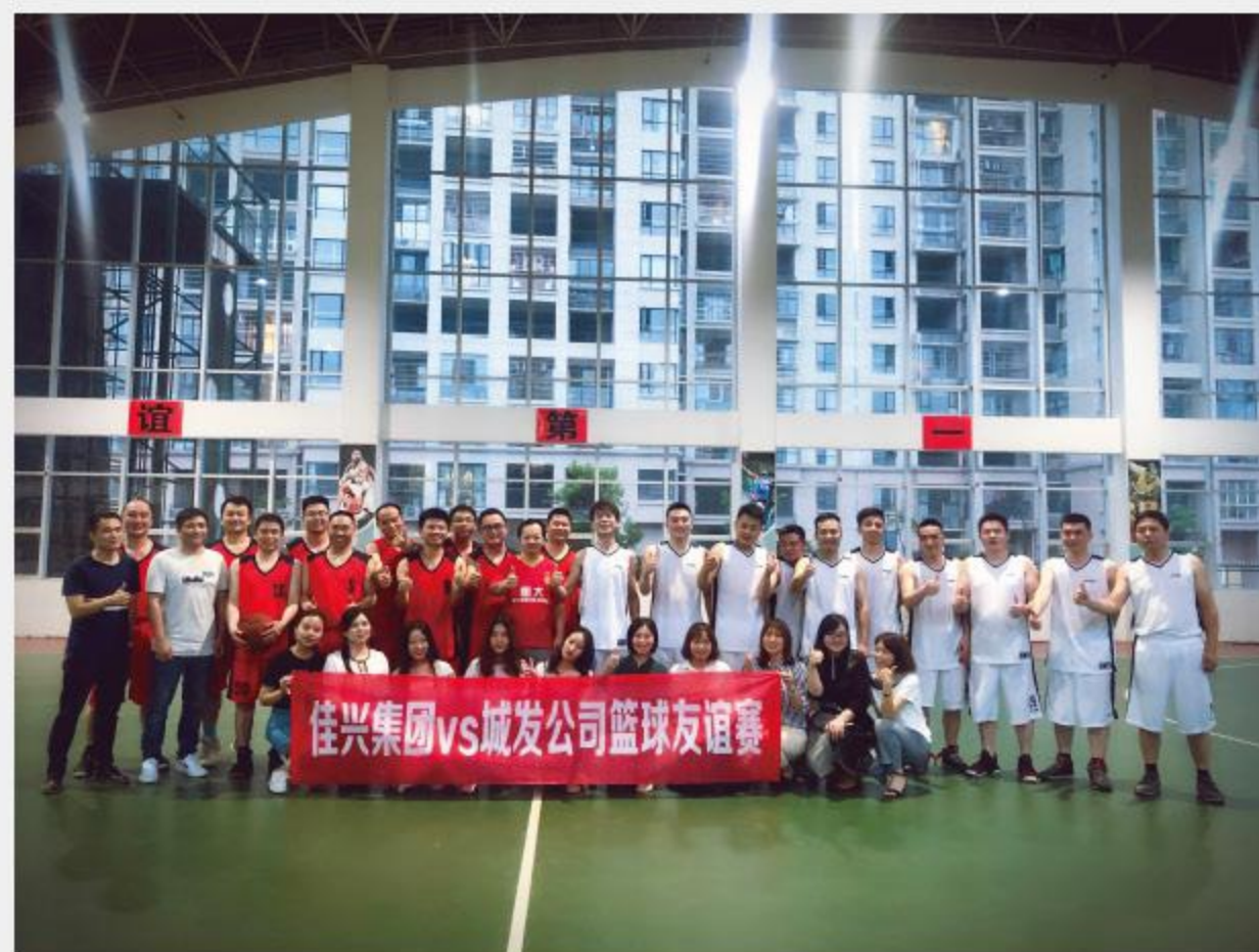
进友谊，赛出南康“建筑人”的精气神。（邓同康）

篮球传递情感，比赛嫁接友谊。赛后，双方队员们纷纷表示，今后将进一步“以球为媒”，促进交流，增